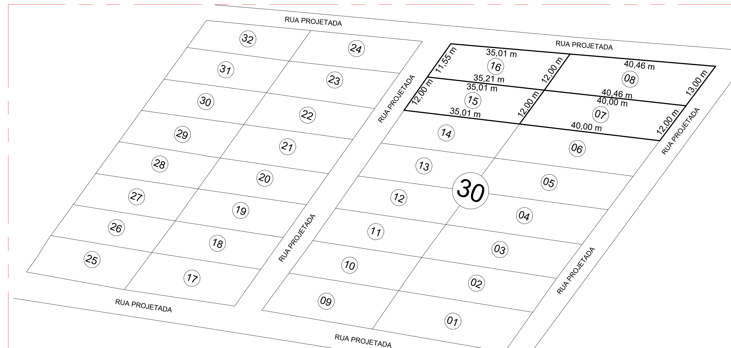
PLANTA DE SITUAÇÃO ESCALA 1/500